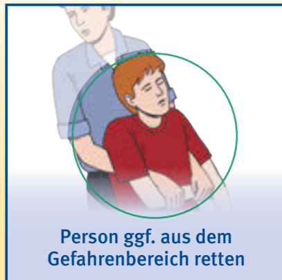
Person ggf. aus dem Gefahrenbereich retten