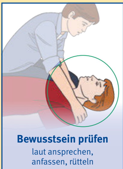
Bewusstsein prüfen laut ansprechen, anfassen, rütteln