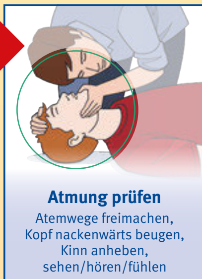
Atmung prüfen Atemwege freimachen, Kopf nackenwärts beugen, Kinn anheben, sehen/hören/fühlen