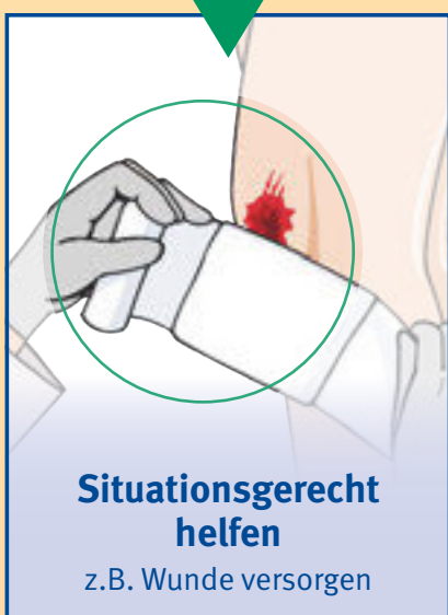
Situationsgerecht helfen z.B. Wunde versorgen